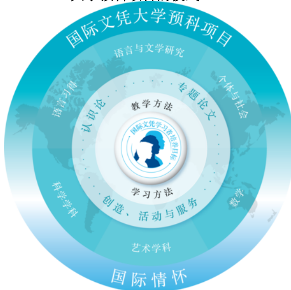
大学预科项目的模式